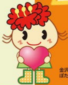
金沢区幸せお届け大使 ぼたんちゃん