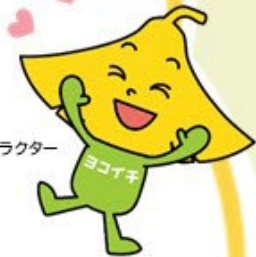
YCUキャラクター ヨッチー

横浜市立大学の学生が見つけた 金沢区のとっておき。 フォロー&いいねで 賞品が当たるかも♪